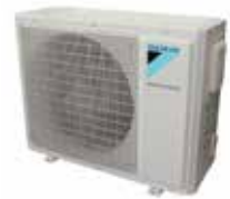
Външно тяло RXV-AB

Daikin има световна репутация благодарение на 90 години опит в успешното производство на висококачествени климатични продукти за жилищна, търговска и промишлена употреба и 56 години като лидер в технологиите за термopомпи.